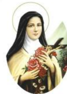
sv. Mala Terezija